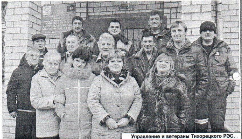
Управление и ветераны Тихорецкого РЭС.

Фронт работ энергетиков Тихорецкого района обширен: 12 сельских поселений и более 70 тысяч жителей с ежегодным средним потреблением около 180 млн кВт/час электроэнер-