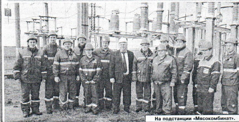
На подстанции «Мясокомбинат».

Н. ВИКТОРОВА, по информации пресс-службы филиала.